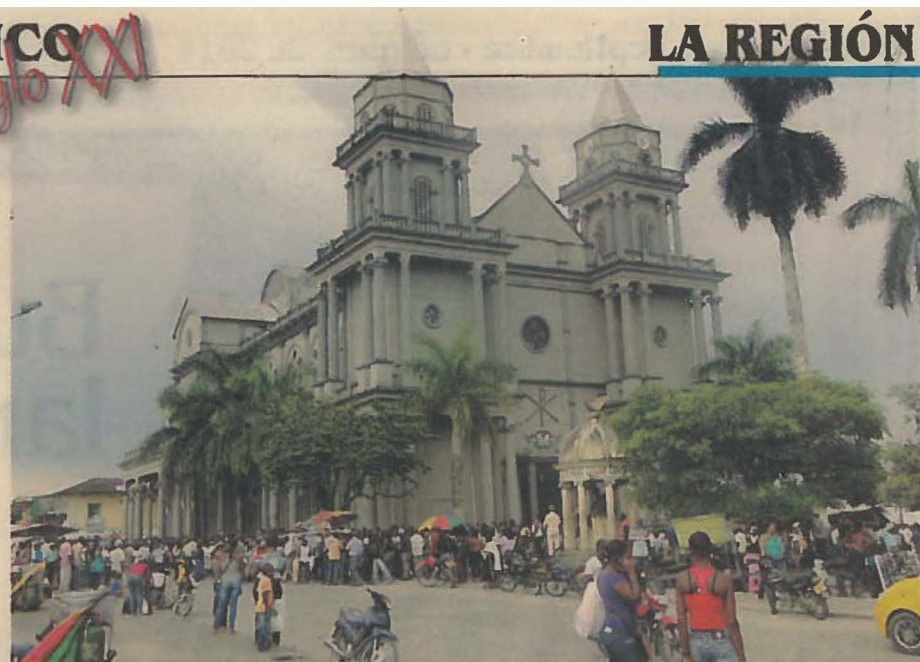
Por lo menos 100 chocoanos participan, voluntariamente, en la investigación del proyecto 'ChocoGen'. Muchos de ellos viven en la capital, Quibdó.

futuro los resultados del trabajo. El objetivo es preparar un informe detallado en el que se le indique al participante el componente genético de su raza y las posibles enfermedades asociadas que pueda padecer según su genética.