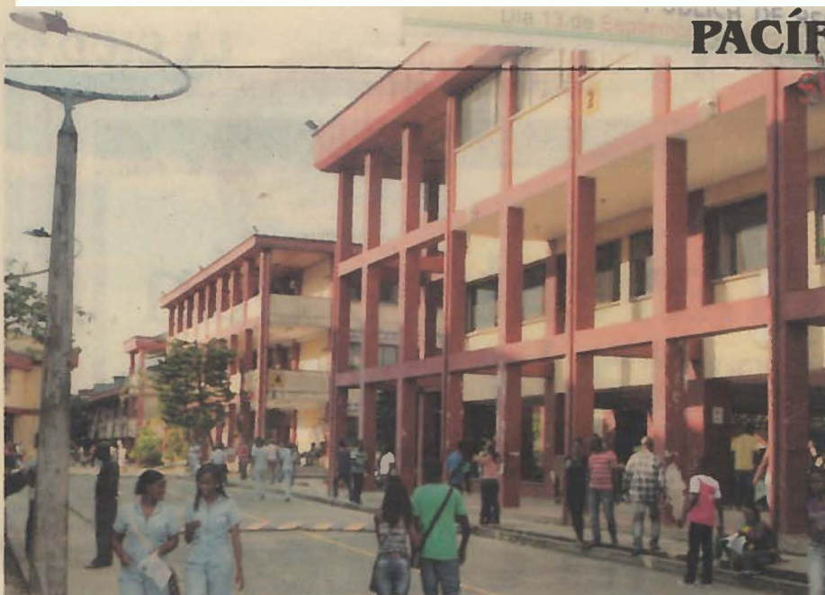
La Universidad Tecnológica del Chocó hace parte del proyecto 'ChocoGen'. También la Universidad de Georgia y el Instituto Nacional de Salud de Washington.